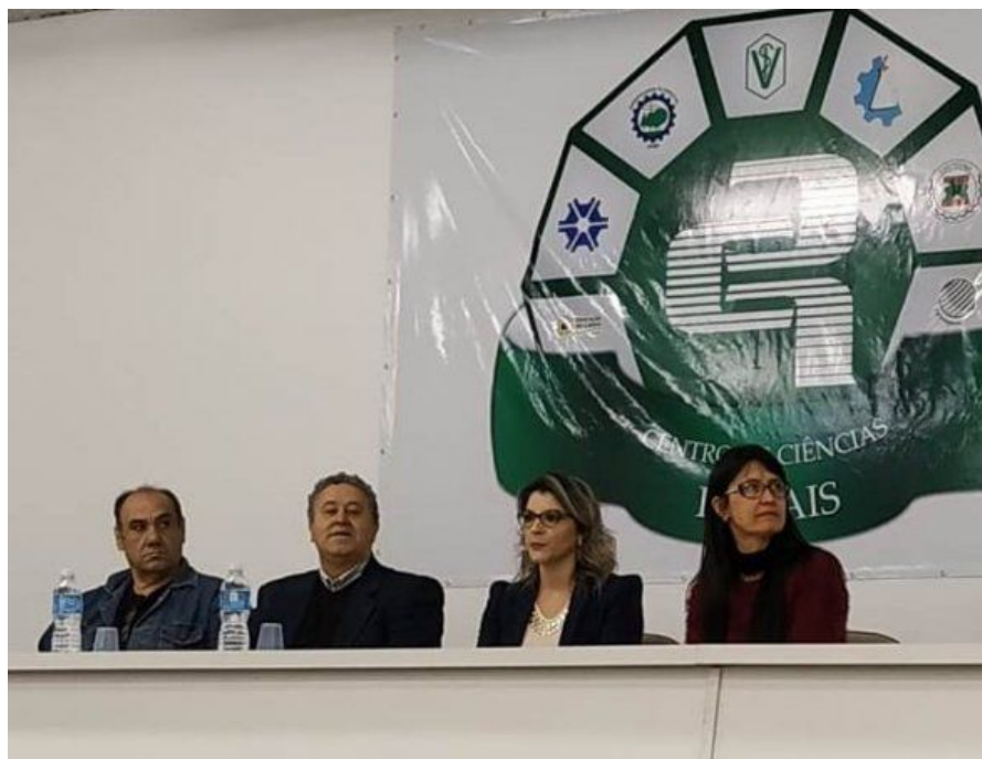
Figura 15 - Mesa de abertura do evento no Centro de Ciências Rurais da UFSM