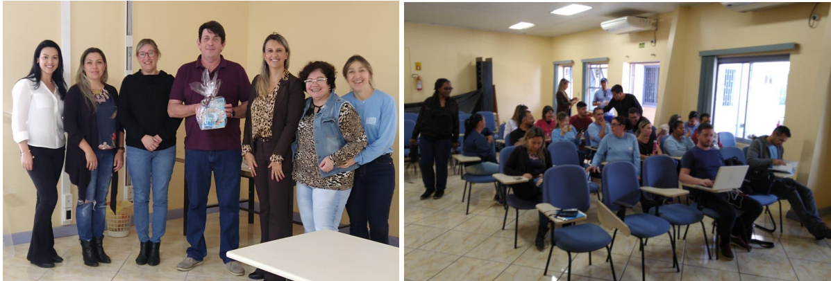
Figura 16 - Palestra referente a Questões Ambientais aos funcionários da CORSAN-SM na sede da Empresa.

Na Segunda-Feira (10), no Santa Maria Tecnoparque aconteceu uma mesa redonda sobre Desenvolvimento Sustentável e como a tecnologia pode ajudar o Meio Ambiente (Figura 17). Com a pergunta “Está correto o Desenvolvimento Sustentável em nosso ecossistema?” algumas Startups de tecnologia residentes na AGITTEC e no Tecnoparque teceram caminhos para ganhos ao Meio Ambiente com a utilização de alguns desenvolvimentos já presentes em nossa cidade.