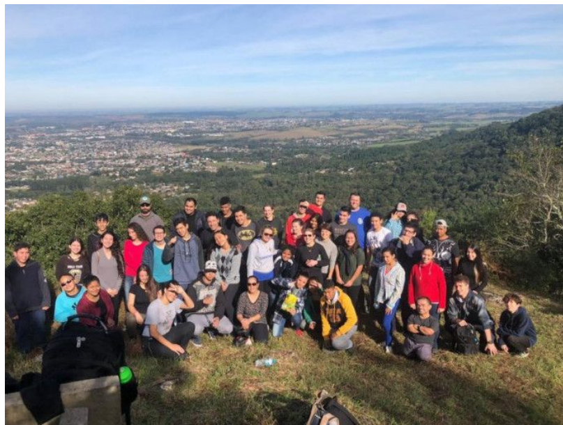
Figura 7 - Alunos da Escola Professora Naura Teixeira Pinheiro no PNMM.

O dia mundial do Meio Ambiente (05/06) foi marcado por uma extensa programação e diferentes públicos foram contemplados. No início do dia os alunos da Escola Estadual de Ensino Médio Professora Naura Teixeira Pinheiro, realizaram uma visita guiada ao Parque Municipal Natural dos Morros (Figura 7). No turno da tarde escolas municipais aproveitaram, no Theatro Treze de Maio, o Teatro Terra à Vista 2. O espetáculo foi possibilitado pela empresa CRVR (Companhia Riograndense de Valorização de Resíduos). Após a encenação de um enredo sobre resíduos recicláveis os alunos da Escola Municipal de Ensino Fundamental Pão dos Pobres Santo Antônio, foram protagonistas de uma ação de sensibilização fantástica na Praça Saldanha Marinho e no Calçadão Salvador Isaias. Eles, juntamente com suas professoras distribuíram 100 mudas de azaléia disponibilizadas pelo Centro de Pesquisa em Florestas da Secretaria Estadual de Agricultura (antiga FEPAGRO) e poesias elaboradas pelos próprios alunos sobre o Meio Ambiente para os municípios que transitavam no local conforme a figura 8 e 9.