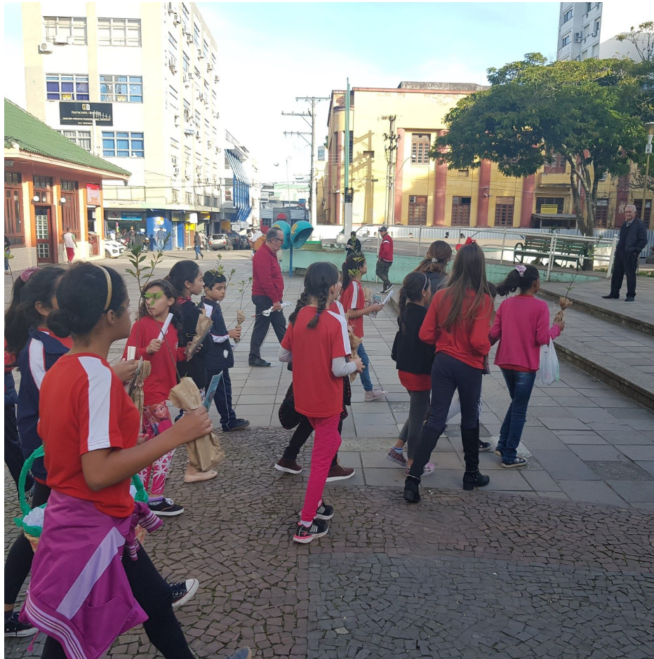
Figura 9 - Ação de sensibilização ambiental para com o público no centro de Santa Maria.