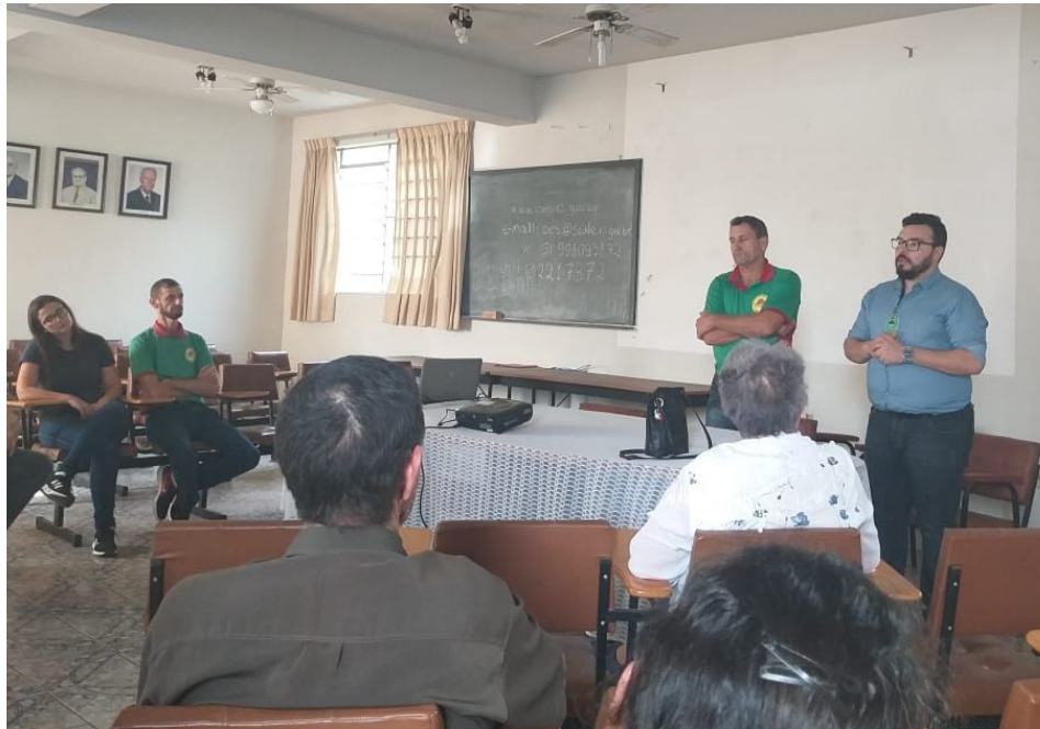
Figura 20 - Abertura do ciclo de palestras sobre Agrotóxicos para produtores rurais no Sindicato dos Trabalhadores Rurais de Santa Maria.

A programação de 2019 foi diversificada e abrangente: palestras, mesas redondas, visitas ao Parque Natural Municipal dos Morros, uma verdadeira relíquia das áreas protegidas nacionais, no Criadouro Conservacionista São Braz, um genuíno mantenedouro de fauna, no Jardim Botânico da UFSM, distribuição de mudas, poesias e textos sobre o Meio Ambiente, caminhada ecológica e como culminância o evento denominando de Virada Ambiental. Após duas semanas intensas de programações técnicas voltadas para diversas áreas, sentiu-se a necessidade da realização de um evento de sensibilização ambiental voltado a comunidade. No decorrer do planejamento e organização da programação da Semana, foram agregados parceiros que auxiliaram e possibilitaram no acontecimento de uma grande festa na Praça Saturnino de Brito (Figura 21). O domingo do dia 16 de Junho de 2019 marcou o início de um projeto para a imprescindível Virada Ambiental.