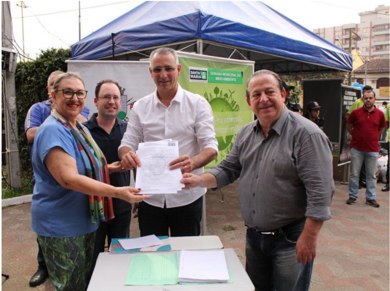
Figura 23 - Prefeito e Secretários em ato de sanção da Lei que altera o Fundo Municipal do Meio Ambiente. Lei nº 6357/2019.

Nesta mesma solenidade, a Empresa Quimea Soluções Ambientais LTDA, entregou ao Senhor Prefeito, o Plano de Gerenciamento de Resíduos Sólidos (Figura 24) do prédio do Centro Administrativo Dr. Nelson Marchezan, na Rua Venâncio Aires, número 2277, como forma de contribuir para a melhoria do meio em que vivemos, partindo do exemplo da própria municipalidade.