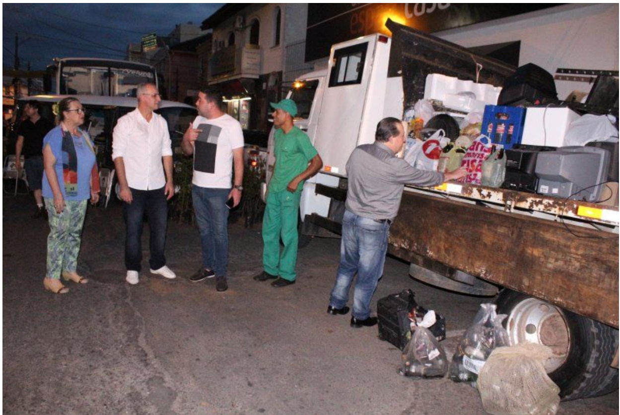
Figura 22 - Ponto de entrega voluntária na Virada Ambiental com mais de uma tonelada recolhida.

Lá estava montado o ponto de entrega voluntária (PEV) de materiais inservíveis e recicláveis. O recolhimento de materiais eletroeletrônicos e recicláveis pela Maringá Metais, Asmar e Sustentare ultrapassou uma tonelada, totalizando 1200kg de resíduos destinados corretamente (Figura 22) beneficiando o meio ambiente. Foi uma ação de ótimo resultado visto a curta duração do evento, ou seja de apenas cinco horas.