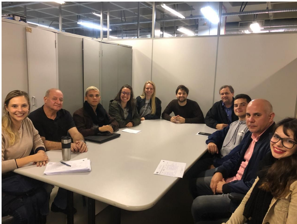
Figura 3 - Visita dos alunos de Engenharia Civil e Arquitetura da UFSM na Secretaria de Município de Meio Ambiente.

No dia 03 de Junho (Segunda-Feira) um café da manhã para imprensa realizado nas dependências da secretaria, marcou o início legal da Semana do Meio Ambiente Na ocasião