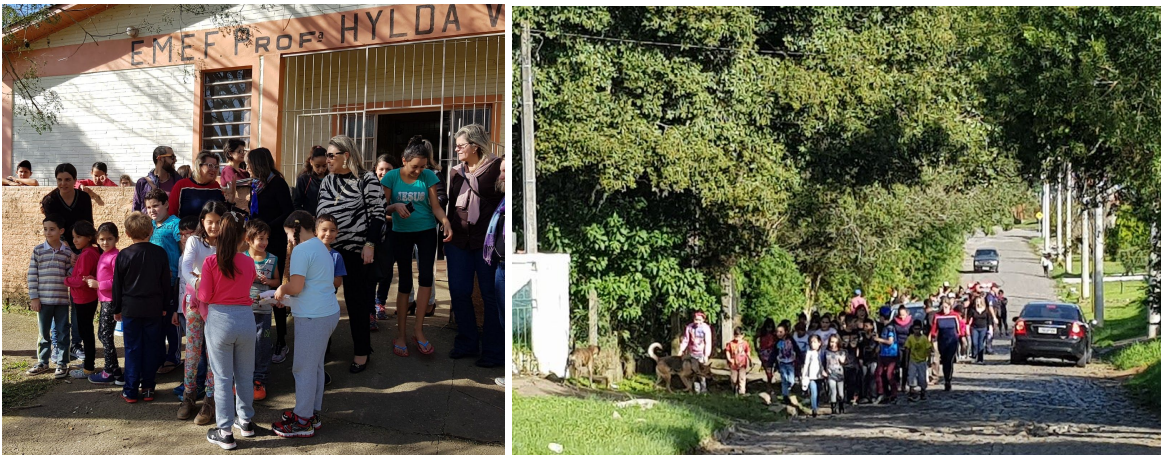
Figura 13 - Integrantes da Secretaria de Meio Ambiente e Educação.

Figura 12 - Saída e a caminhada ecológica dos alunos da Escola Hylda Vasconcellos na Estrada do Perau.