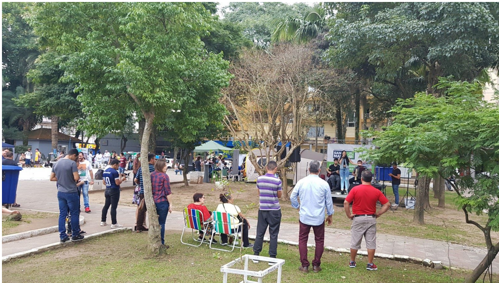
Figura 21 - Atração Musical na Virada Ambiental.

Lá estava montado o ponto de entrega voluntária (PEV) de materiais inservíveis e recicláveis. O recolhimento de materiais eletroeletrônicos e recicláveis pela Maringá Metais, Asmar e Sustentare ultrapassou uma tonelada, totalizando 1200kg de resíduos destinados corretamente (Figura 22) beneficiando o meio ambiente. Foi uma ação de ótimo resultado visto a curta duração do evento, ou seja de apenas cinco horas.